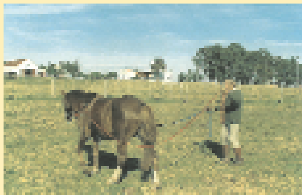
Treballant a la seva etapa sud-americana a la Pampa.

- Que intentin fer coses noves i diferents, perquè les imitacions sempre són dolentes. Els aconsellaria que tinguin imaginació i coratge per fer coses tant en l'àmbit de l'esport com de l'educació física més en general. Per exemple, ara sembla que l'àmbit de la salut és una veritable veta professional per explotar, de present i de futur.